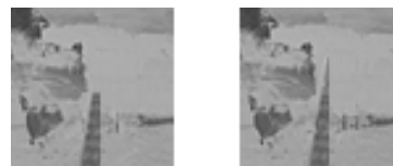
FIGURE 3 – Zoom sur la reconstruction de la zone indiquée sur la Figure 2, de gauche à droite : l'AMB ; le R-algorithme.